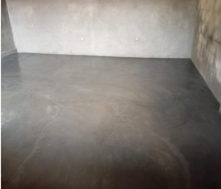
Une vue d'ensemble