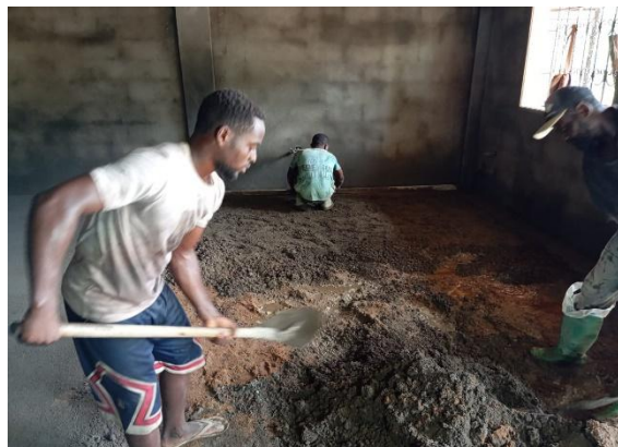
Coulage et lissage du sol en cours ...