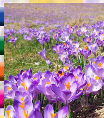
Prémice du Printemps

À la suite de Jésus, vivre c'est apprendre à ressusciter : C'est apprendre à vivre en homme et en femme, Chaque jour, de façon humaine, tout simplement, C'est apprendre à donner de soi, c'est apprendre à croire Que Dieu se consacre au bonheur du monde, C'est apprendre à espérer que la vie a un sens Et que la mort est un passage, C'est apprendre à aimer à la façon de Dieu, À écouter l'Esprit de Dieu en nous. C'est apprendre à s'arracher au mal, À partager avec chacun ce qui est nécessaire à la vie, À refuser des situations indignes de l'être humain, c'est lutter, Ne pas se taire quand la qualité de la vie est en cause et celle de l'amour, C'est apprendre à vivre selon l'Évangile.