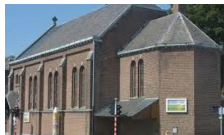
Oasis de la Miséricorde

est ouverte pendant les mois de juillet et août :