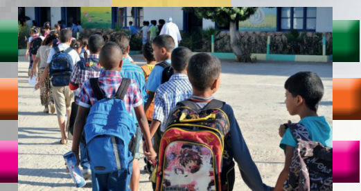
La rentrée des classes