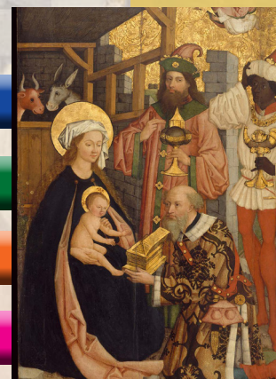
La visite des mages

Bulletin d'information N° 109 Janvier 2025 De l'UP Soumagne-Olne-Melen